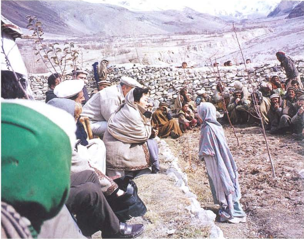
パキスタンの最北端で、「進学したいけれど中学校がない」と、泣いてうったえる少女の話聞く。山脈のむこうは、アフガニスタンと中国。