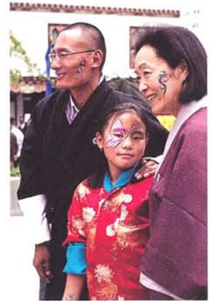
ブータンの若い政治家とその娘と、お祭りを楽しむ。次代を担う人たちの相談相手にと、頻繁に通っている。